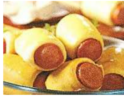
ENROLLADOS DE SALCHICHA