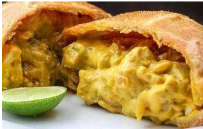
EMPANADA DE AJI DE GALLINA

Empanadas rellenas de carne, jamón y queso doble crema, con aderezo especial peruano, y al horno