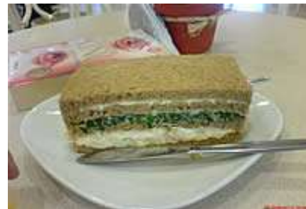
TRIPLES DE ESPINACA Y QUESO