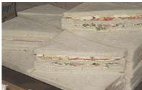
TRIPLES DE POLLO Y JAMON