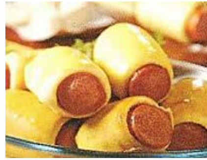
ENROLLADOS DE SALCHICHA