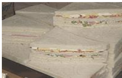
TRIPLES DE POLLO Y JAMON