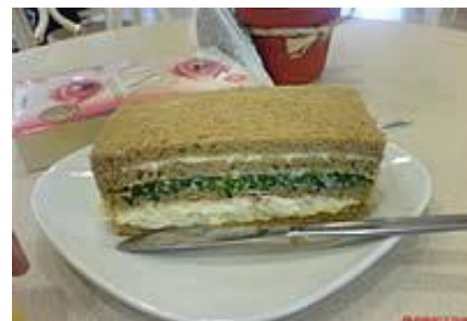
TRIPLES DE ESPINACA Y QUESO