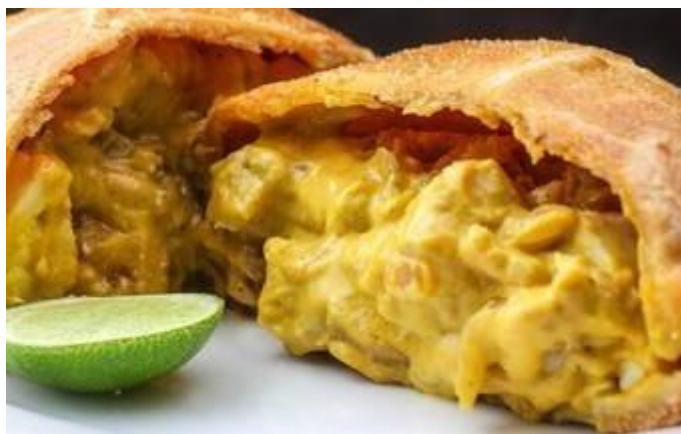
EMPANADA DE AJI DE GALLINA

Empanadas rellenas de carne, jamón y queso doble crema, con aderezo especial peruano, y al horno